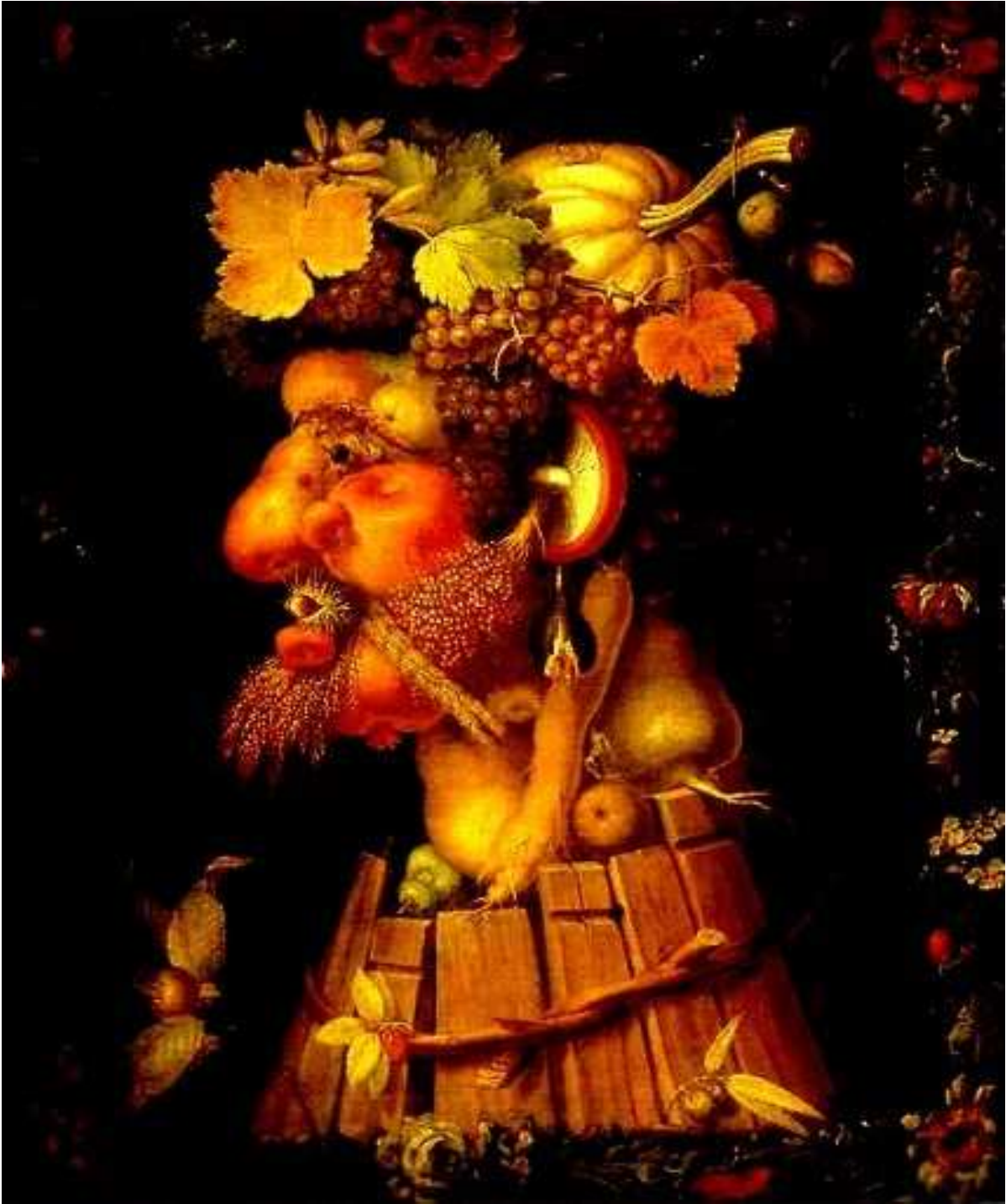
"L'Autunno" di G. Arcimboldo.